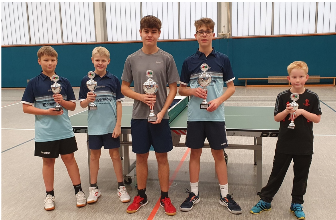
Die neuen Stadtmeister im Jugendbereich.