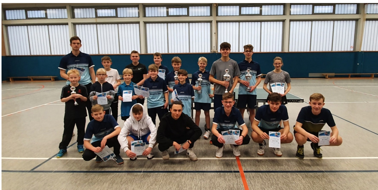
Die erfolgreichen Teilnehmer der Jugendklassen.