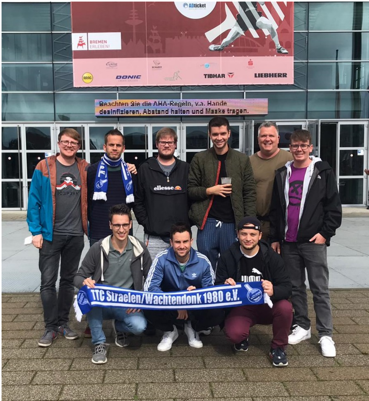
Die Fangruppe des TTC Straelen/Wachtendonk bei den Deutschen Meisterschaften in Bremen

Und natürlich sorgten die TTCler selbst dafür, dass es ein Wochenende mit Gemeinschaftserlebnis wurde. Eigentlich sollte es aber um mehr gehen.