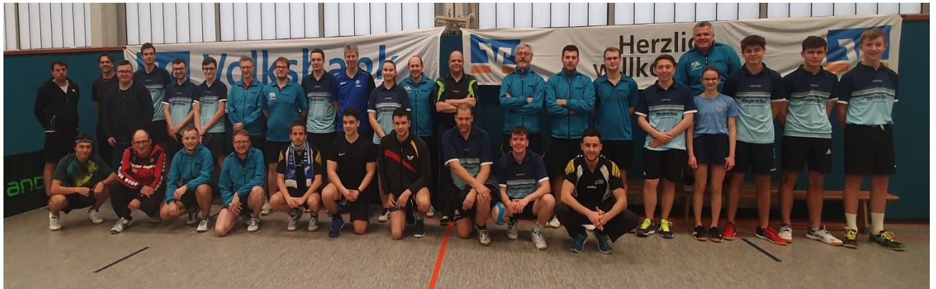
Die Teilnehmer der Seniorenklasse vor der Turnier.