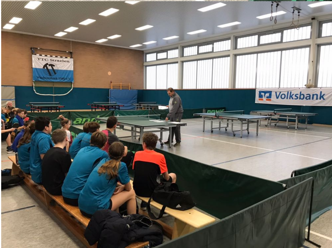
Begrüßung Schüler- und Jugendklassen