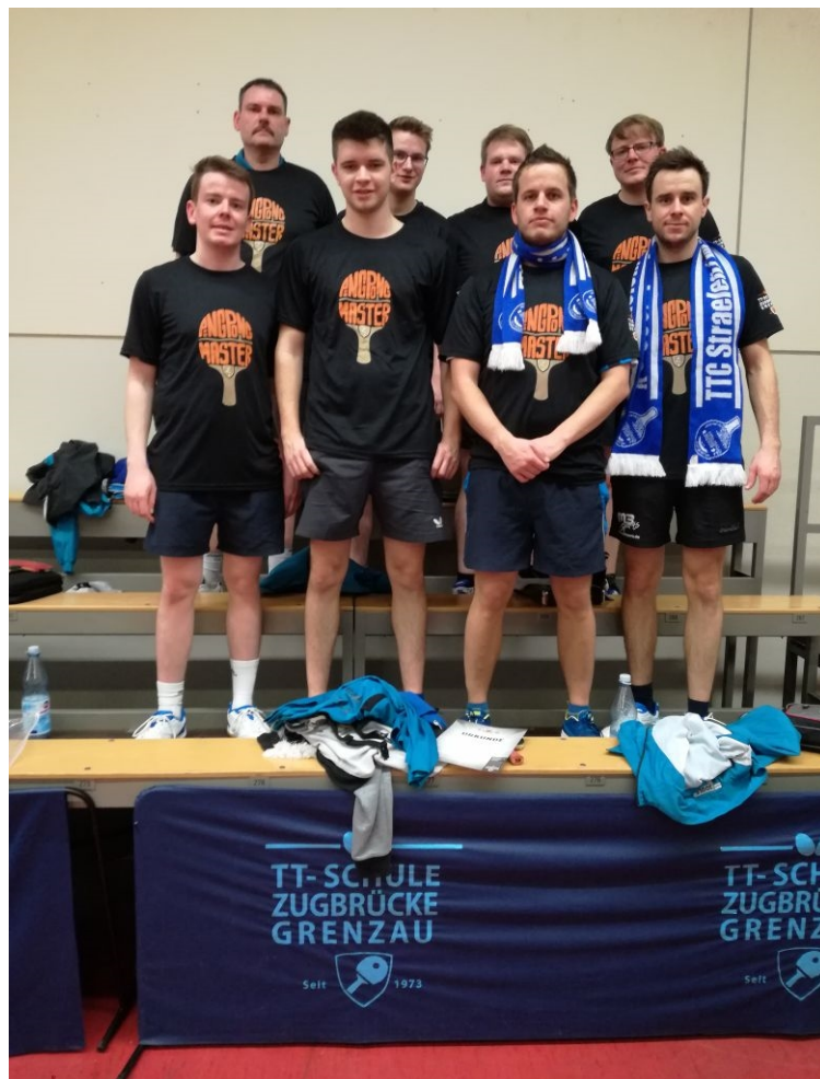
Mit den obligatorischen TT-T-Shirts