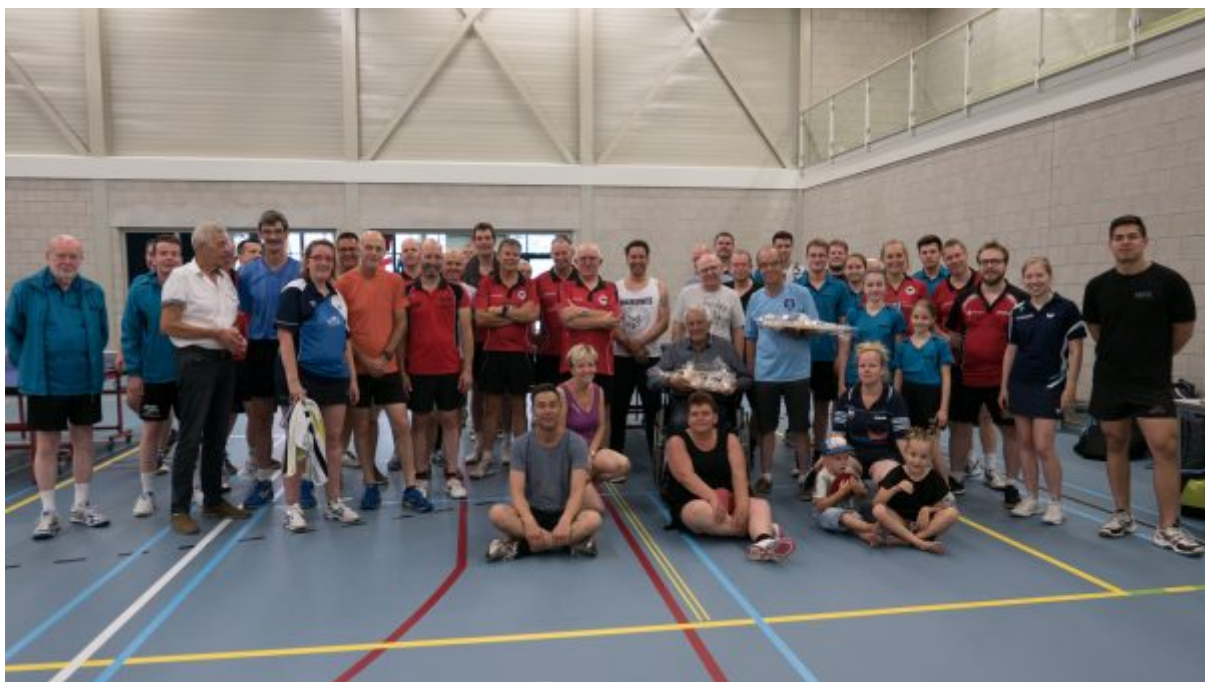
Gruppenfoto aller aktiven TT-Spieler