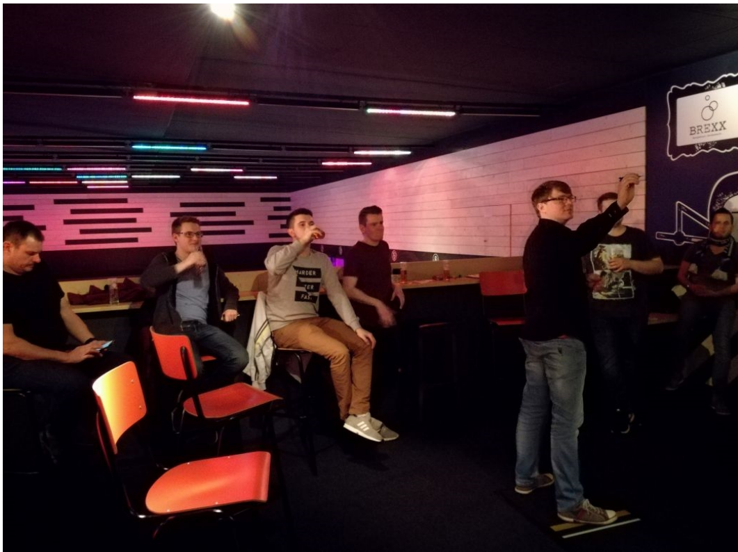
One hundred and eighty.....