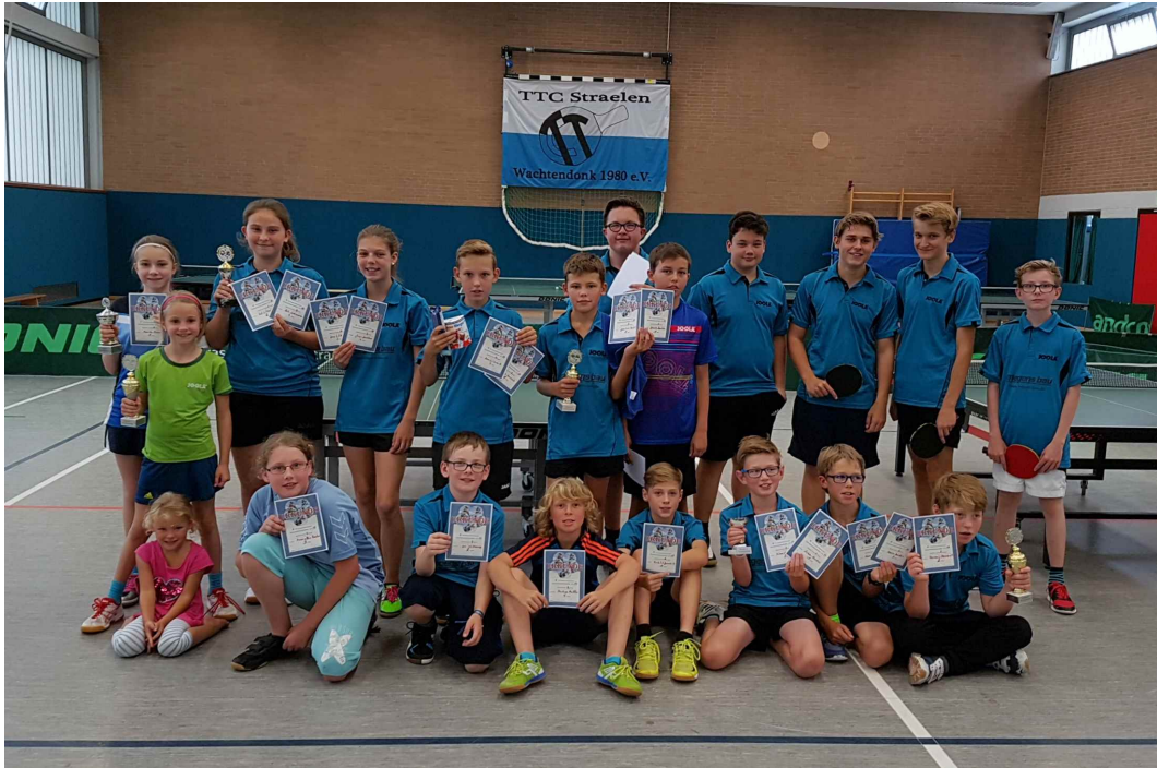
Foto: Die Jugendsieger der Vereinsmeisterschaften 2017 des TTC Straelen/Wachtendonk stellen sich stolz dem Fotografen