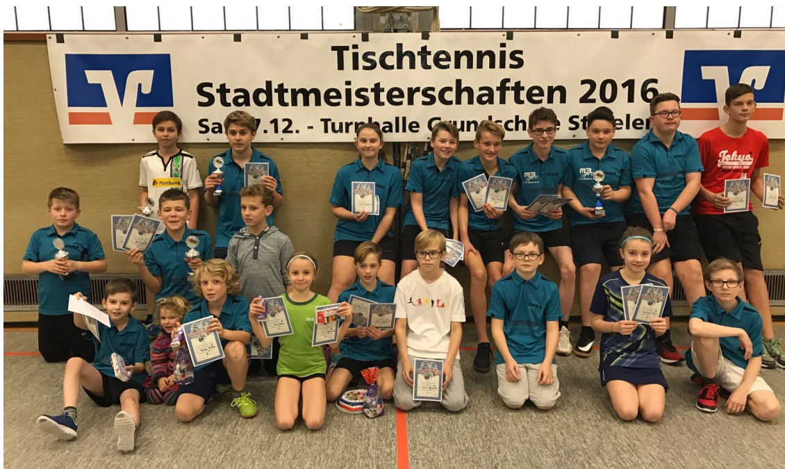
Die Sieger der Stadtmeisterschaften 2016