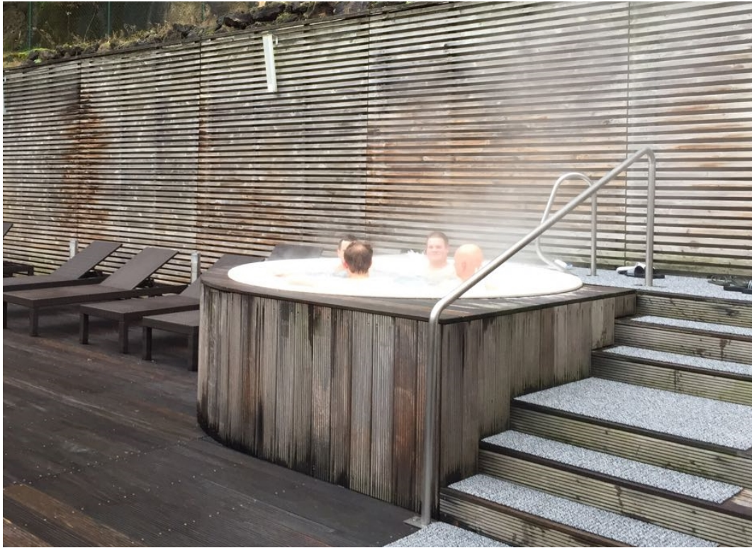
Richtige Erholung ist wichtig