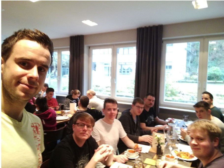
Ein guter Start in den Tag...