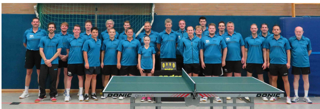
Foto: Saisonstart der vier Herrenmannschaften des TTC Straelen/Wachtendonk