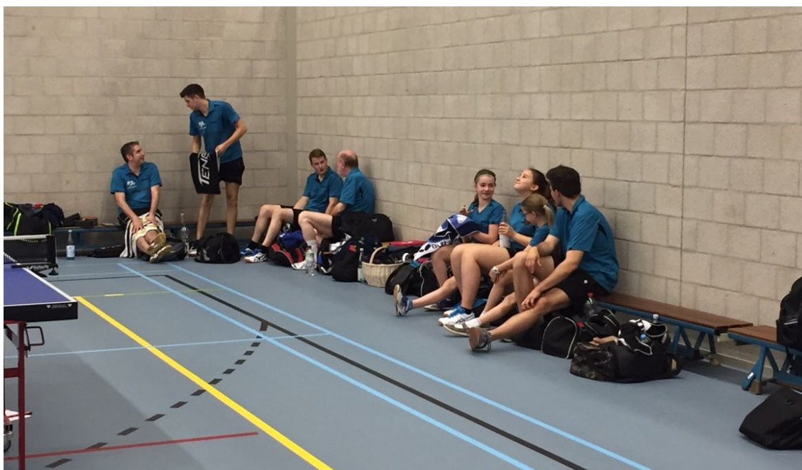
Pause zwischen den Runden