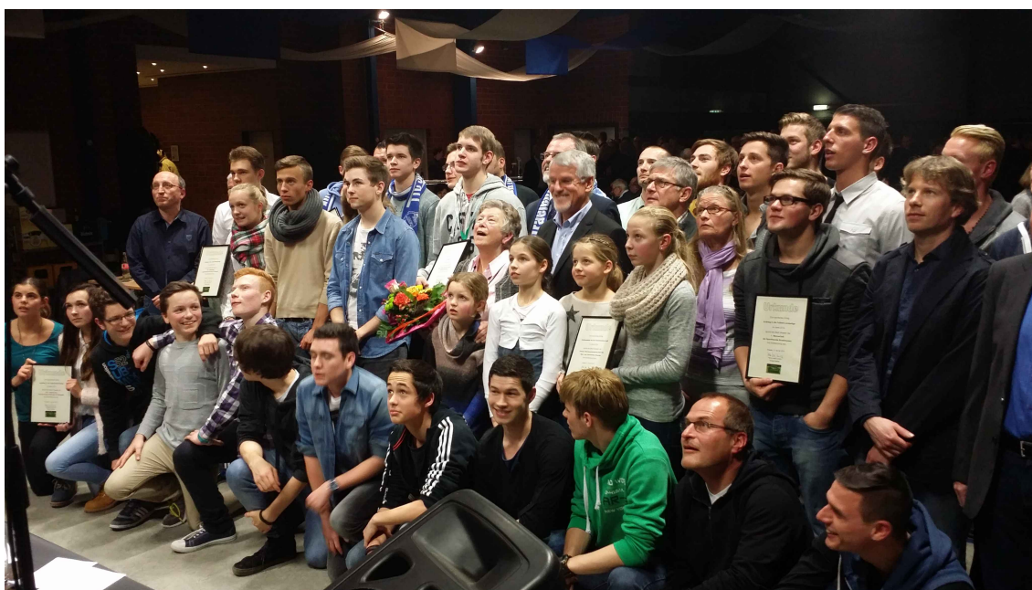
Der TTC Straelen/Wachtendonk beglückwünscht alle Sportler zu dieser Auszeichnung !!!

Hier der Link zum Artikel der Rheinischen Post vom 12.01.2015