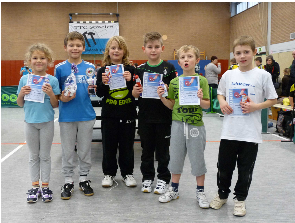
Schüler D nach der Siegerehrung