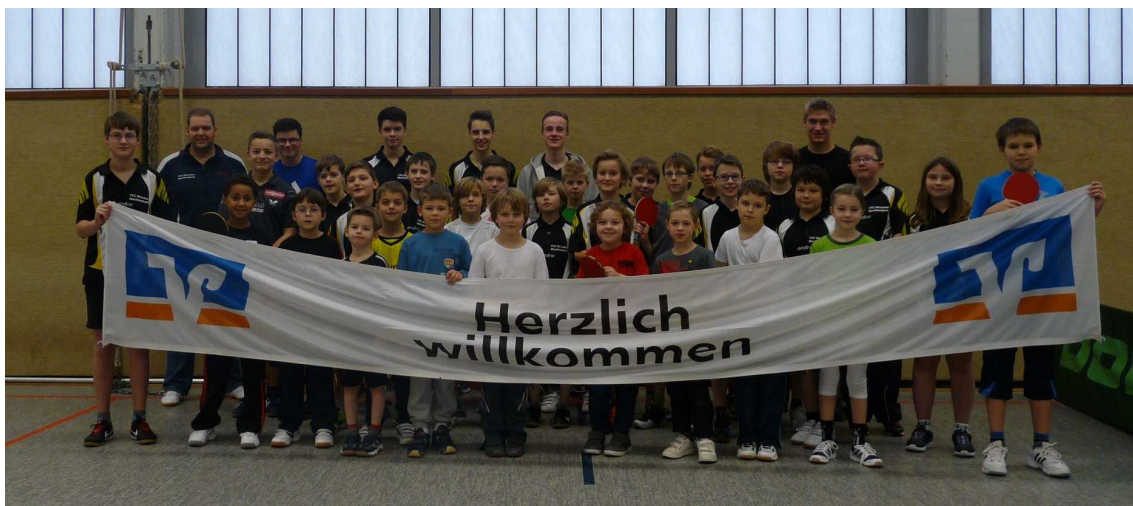
Die Teilnehmer 2013 in den Schüler- und Jugendklassen

13.12.2014 Halbzeitbilanz: Mit roter Laterne in die Weihnachtspause – 2. Mannschaft überrascht dagegen positiv