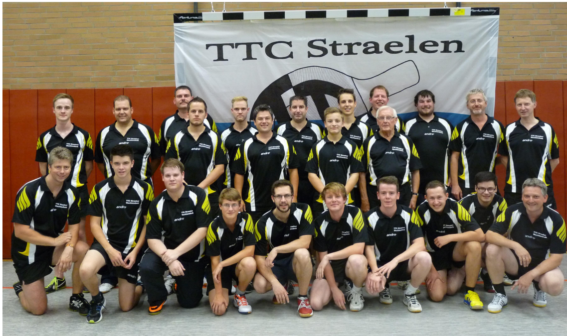
Foto: Die Herrenmannschaften des TTC Straelen/Wachtendonk präsentieren sich unabhängig vom Tabellenstand in bester Laune vor ihrer Vereinsfahne.