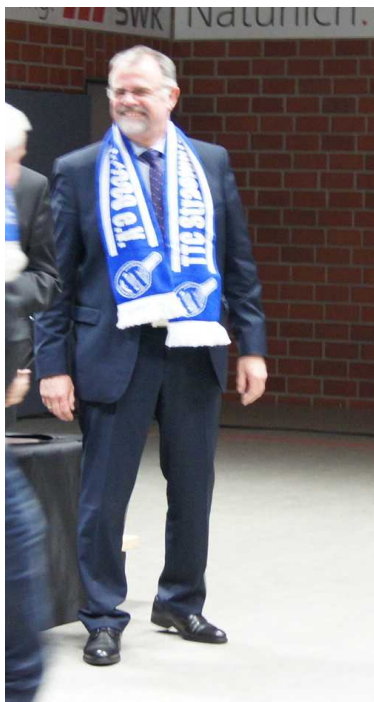
Straelens Bürgermeister mit TTC Schal !!!