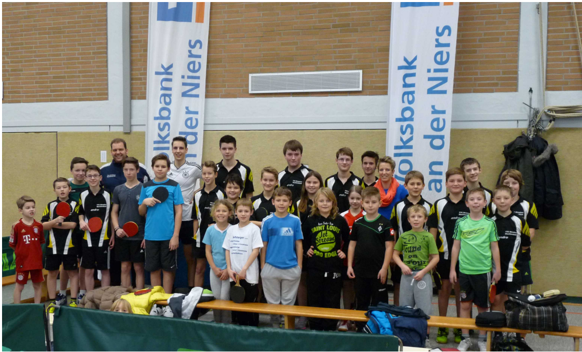
Gruppenbild unserer Schüler und Jugendliche mit Sponsor Volksbank an der Niers