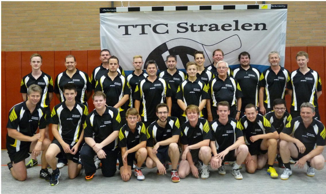
Foto: Die Herrenmannschaften des Tischtennis-Clubs Straelen/Wachtendonk zeigten Geschlossenheit auch bei Niederlagen in den höheren Klassen